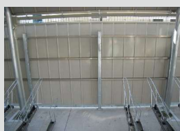
[背面・側面パネル] …P.19